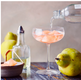
Quitte und Orangenblüte